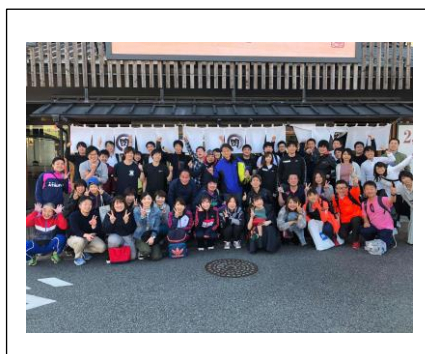
打ち上げ後の集合写真