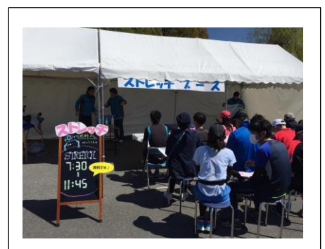
ストレッチブース